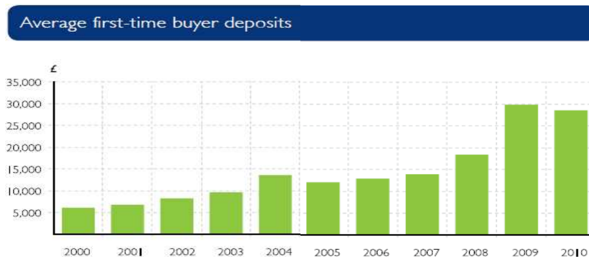
Tabl 1 – Blaendaliadau cyfartalog gan brynwyr tro cyntaf 2000-2010

1.8 Mae'r tabl isod yn dangos y wybodaeth ddiweddaraf o ran gwerthiannau tai o bob math ar draws y sir.